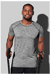
ST8840 Recycled Sports-T Reflect