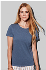
ST7600 Lux Fitted