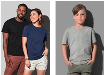
ST2020 Classic-T Organic