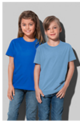
ST2200 Classic-T Kids