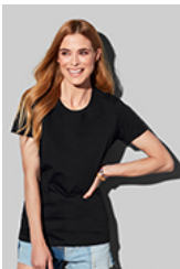
ST2160 Comfort-T 185