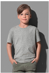
ST2220 Classic-T Organic Kids