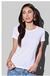
ST2620 Classic-T Organic Fitted