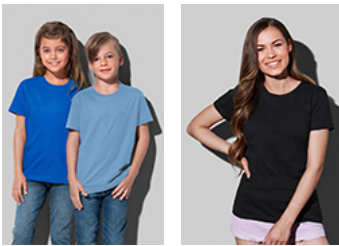
ST2200 Classic-T Kids